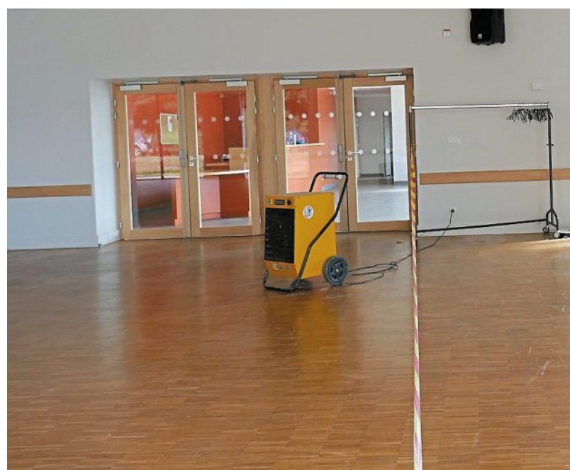
Quatre déshumidificateurs ont été installés dans la salle polyvalente pour absorber l'humidité, ce qui a évité, par exemple, le décollage du parquet.

Compte tenu du renouvellement fréquent des locataires, notamment dans les petites surfaces, et de la spécificité de la gestion des bâtiments avec des particuliers, le conseil a validé la délégation de cette compéten-