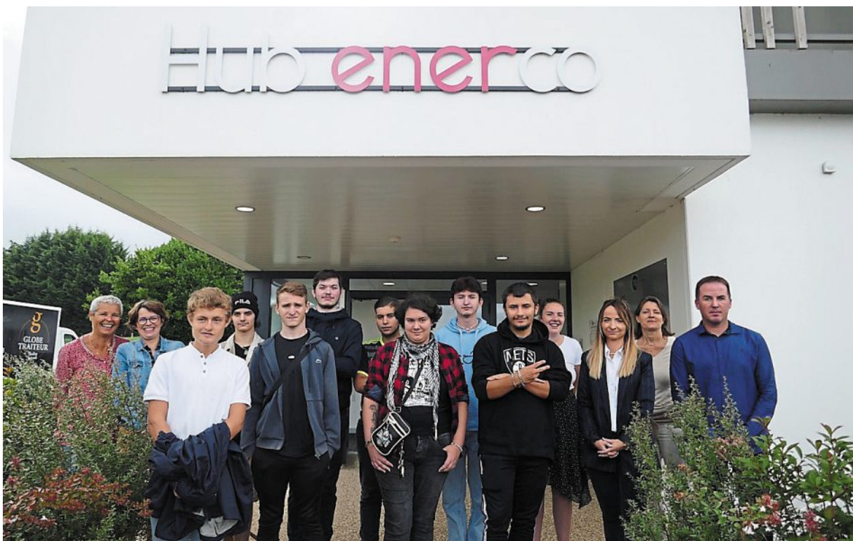
Les huit jeunes, au Hub Enerco, avec les conseillers de la Mission locale et deux animatrices du service économique de CMC. | PHOTO : OUEST-FRANCE

Les visites ont été suivies par des échanges entre les jeunes et les employeurs, les premiers essayant